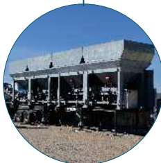
Mobile Hopper Bins Groupe de Trémies Mobile