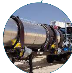
Mobile Counterflow Drum Dryer Sécheur à contre-courant Mobile