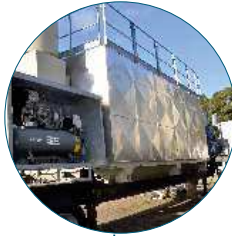
Mobile Baghouse Filter Filtre à manches Mobile