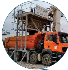
Discharge Hopper Trémie de décharge